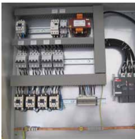
Control panel for the Aalborg EH electrical heater